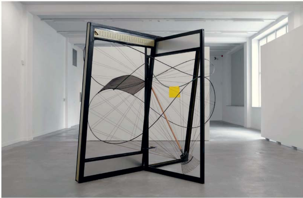
Johan Gelper, Objects in a spheric theme , 2015, aluminium, verf, ijzer, koolstof, touw en hout, 260 x 220 x 240 cm M – MUSEUM LEUVEN